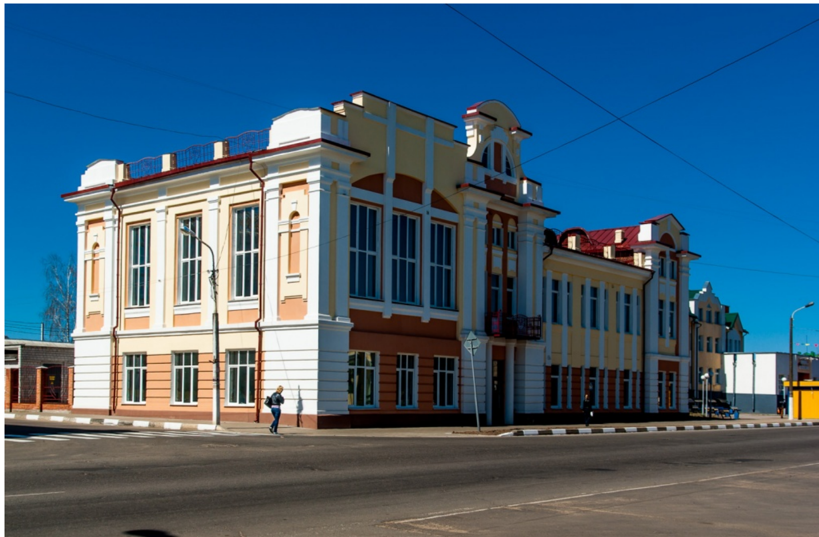
дом родственников В.Короткевича

В прошлом здесь располагалась земская управа, которая занималась местными делами. Сегодня в здании находится Рогачевский районный исполнительный комитет.